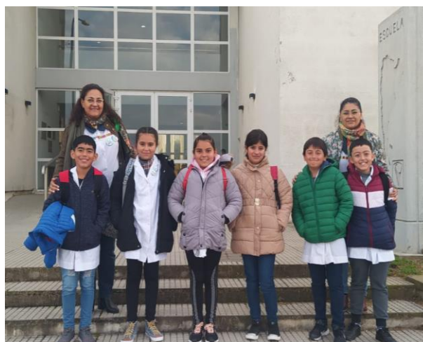
Escuela 6123 presente en el Encuentro de alumnos cooperativistas y Mutuales.